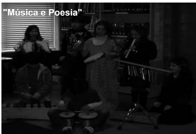
"Música e Poesia"

Semana da Leitura Semana da Leitura Semana da Leitura Semana da Leitura Semana da Leitura