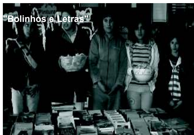
"Bolinhos e Letras"