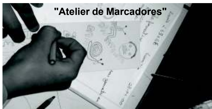
"Atelier de Marcadores"