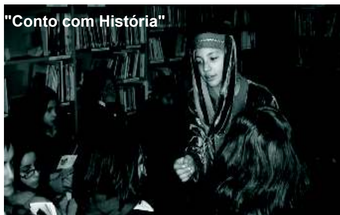
"Conto com História"