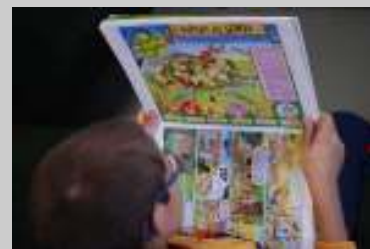
Apanhado a ler!