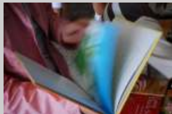
Apanhado a ler!