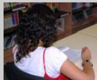
Apanhada a ler!

Este ano lectivo, a escola decidiu aderir ao Concurso Nacional de Leitura, iniciativa no âmbito do Plano Nacional de Leitura, inscrevendo 79 alunos, do 7º ao 9º. Esta iniciativa foi considerada tão positiva, que os professores de Língua Portuguesa resolveram organizar um concurso interno dirigido ao 2ºCEB.