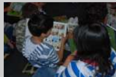
Apanhado a ler!