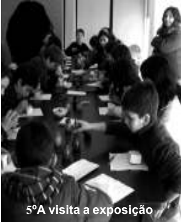
5ª visita a exposição